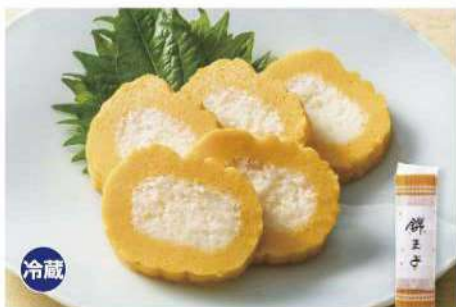
030 錦玉子 250g 卵の黄と白を、金銀を意味する錦に見立てた縁起物です。 アレルギー 卵 賞味期限 2025年1月5日 税込価格 1,728円 (本体価格 1,600円)