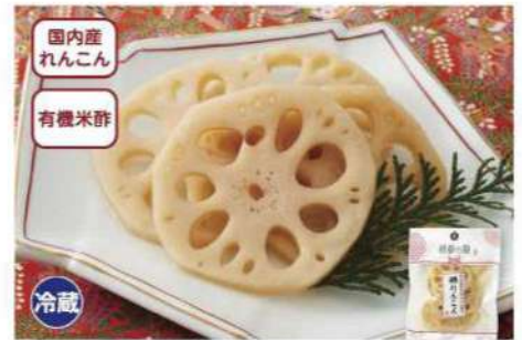
029 酢れんこん 70g 独特の歯ごたえのれんこんには、先の見通しが良くという縁起があります。 賞味期限 2025年1月10日 税込価格 681円 (本体価格 630円)