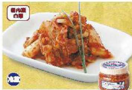
067 関家・白菜キムチ 400g