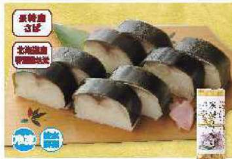
061 寒鯖(かんさば)押寿司 1本(8切れ)

アレルギー 小豆・大豆 ¥2,052円 賞味期限 90日間 (本体価格 1,900円)