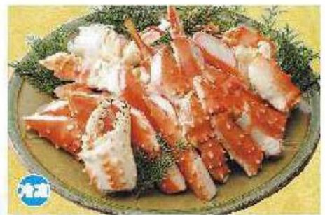
056 ボイルカットタラバ 800g