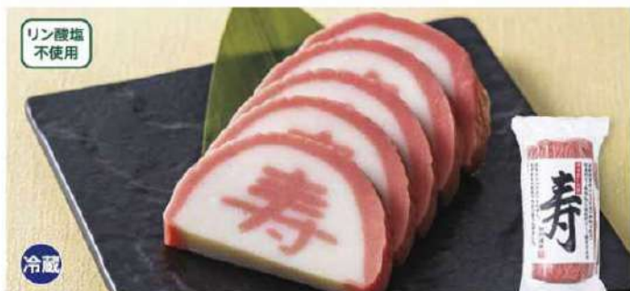
008 お正月用かまぼこ(寿)紅 1本(180g)

無リン魚肉すり身を100%使用し、つなぎのでん粉を全く使用せず、昆布とかつおの合わせだし・砂糖・食塩・味醂・魚醤で味付けしたかまぼこに「寿」の文字を入れました。紅色はトマト色素を使用しています。