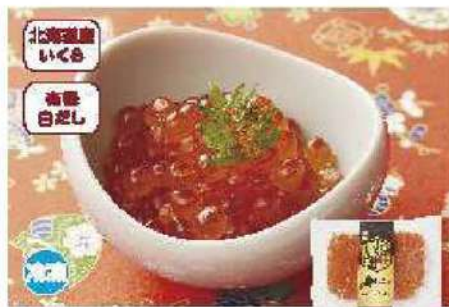
055 いくら醤油漬け 130g

秋鮭の旬の時期でも9月最終週から10月中旬くらいまでに水揚げされる鮭の卵を、有機白だしで漬けてみました。