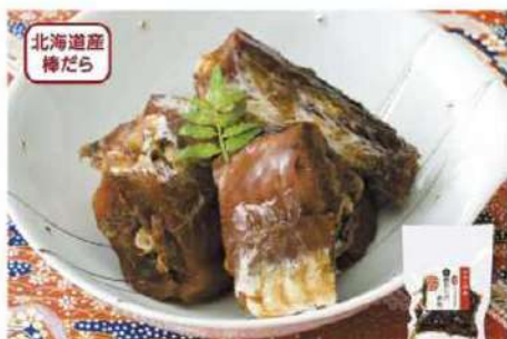
039 棒だらの煮物 200g

「鰯頭食べられる」や「福を招く」のいわれがあり、特に関西ではおせち料理の定番です。