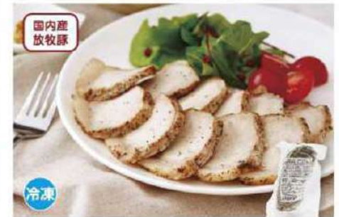
086 北海道放牧豚のローストポーク 250g

アレルギー 小麦・大豆 賞味期限 2025年1月3日 税込価格 1,674円 (本体価格 1,550円)