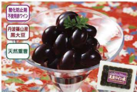
027 丹波篠山産黒豆ワイン煮 180g(内容総量330g) 丹波篠山産の黒大豆を、酸化防止剤不使用の香り豊かな赤ワインで柔らかく煮上げました。色調を安定させるための鉄分は使用していません。 アレルギー 大豆 賞味期限 2025年4月30日 税込価格 1,253円 (本体価格 1,160円)