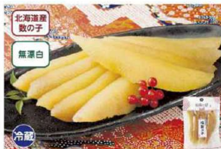
044 塩数の子(国内産数の子) 150g

希少な、北海道に育ったニシンの魚卵を使用。無漂白のため、色にパラツキがありますが、本来の旨味と食感です。