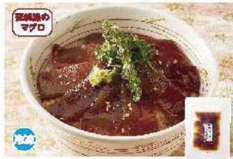
064 天然まぐろ漬け丼の素 70g×2袋

アレルギー 小豆・大豆 ¥1,998円 賞味期限 90日間 (本体価格 1,850円)