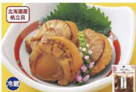
040 帆立貝うま煮 5個