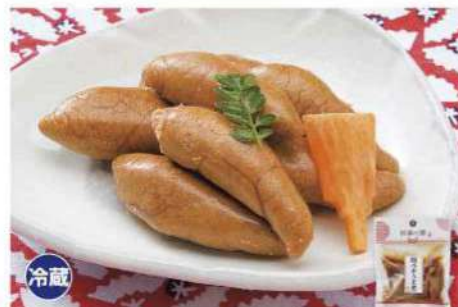
031 鱈(たら)の子うま煮 90g 魚の卵は、数が多いことから子孫繁栄の縁起物とされています。 アレルギー 小麦・大豆 賞味期限 2025年1月10日 税込価格 1,404円 (本体価格 1,300円)