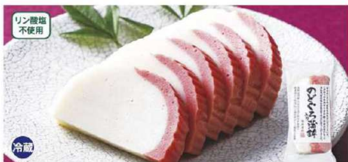
012 のどぐろ入り蒲鉾(紅白) 1本(180g)

賞味期限 2025年1月3日 税込価格 1,728円 (本体価格 1,600円)