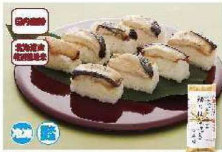
063 鯖(さわら)の柚庵焼き押寿司 1本(8切れ)

アレルギー 小豆・大豆 ¥1,998円 賞味期限 90日間 (本体価格 1,850円)