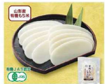
099 有機しゃぶしゃぶ餅・白米 120g