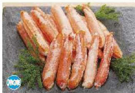
058 ずわい蟹神肉 400g

解凍不要の神肉は、解凍してそのまま食べるだけでなく、サラダや天ぷらなどの料理にもお使いいただけます。