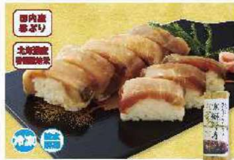
062 寒鯖(かんぶり)押寿司 1本(8切れ)

アレルギー 小豆・大豆 ¥1,890円 賞味期限 90日間 (本体価格 1,750円)