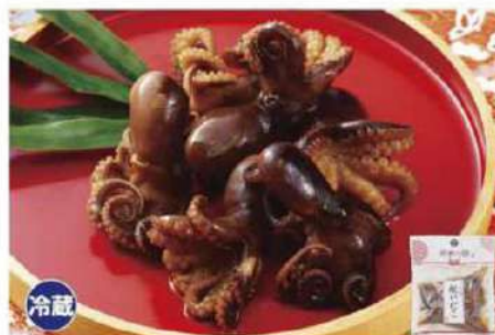
047 祝いだこ 80g