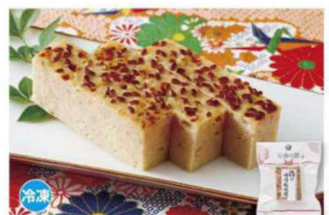
035 鶏の味噌松風焼き 90g 味付けした鶏挽き肉の上に煎りごまをまぶした一品。「裏には何も無い、正直な生き方」という縁起があります。 アレルギー 卵・小麦・大豆 賞味期限 1年間 税込価格 864円 (本体価格 800円)