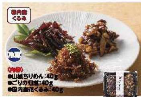
052 ニニニ三三団子 120g