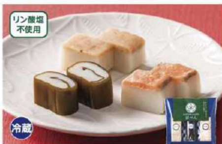
037 はべん 白えび・サーモン・昆布セット 3本

パッと開けてパクッと食べられる、食べきりサイズの富山の蒲鉾。あっさりとした蒲鉾に、香ばしい白えび、しっとりとした「サーモン」を合わせ、富山名産「昆布巻」とセットにしました。