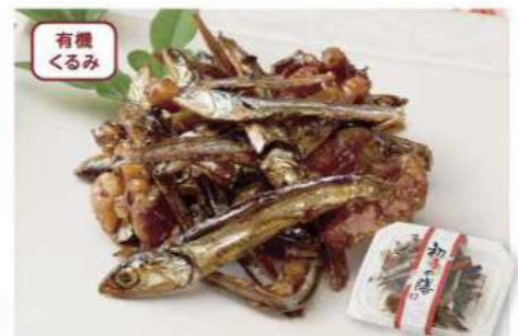
032 有機くるみ入り田作り 45g おせちの定番「田作り」に、香ばしく貴重な有機くるみを加えました。 アレルギー 小麦・くるみ・大豆 賞味期限 2025年1月15日 税込価格 821円 (本体価格 760円)