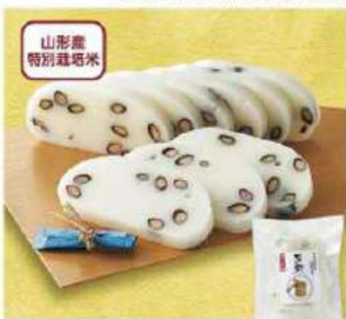
096 特別栽培米使用・杵つき豆餅 500g

山形県庄内産の品種「でわのもち」を使用。なめらかな餅の食感に、黒豆とよもぎが相性抜群です。