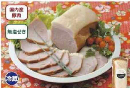
084 アルファー・モモハム 300g

賞味期限 2025年1月3日 税込価格 2,862円 (本体価格 2,650円)