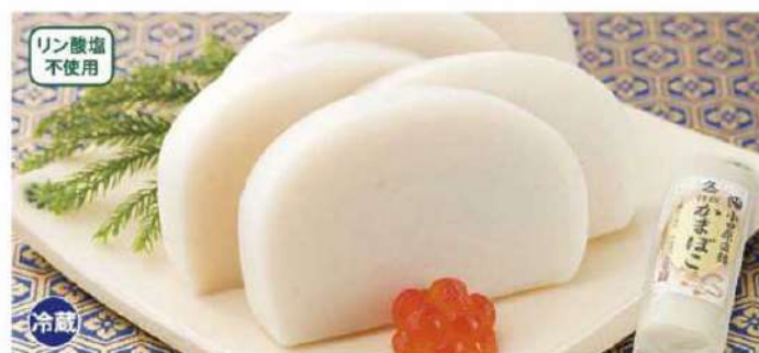
011 小田原かまぼこ(白) 1本(230g)

賞味期限 2025年1月3日 税込価格 1,728円 (本体価格 1,600円)