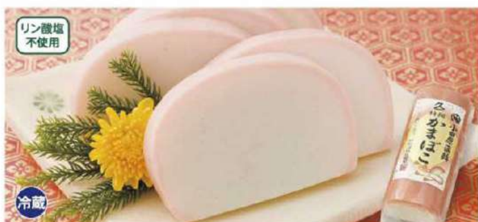
010 小田原かまぼこ(紅) 1本(230g)

賞味期限 2025年1月10日 税込価格 1,566円 (本体価格 1,450円)