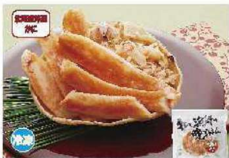
057 ずわい甲羅盛り 130g