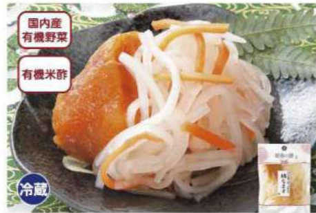
028 有機野菜使用・柿なます 180g 国内産有機の大根と人参の紅白なますに、市田産の干し柿を加えてマイルドに仕上げました。 賞味期限 2025年1月10日 税込価格 681円 (本体価格 630円)