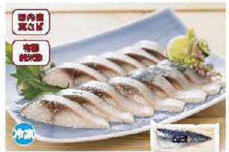
050 しめ鯖 1枚(120g)

産ののった国内産真さばを有機純米酢、天日塩、粗塩で味付け、少し甘みのゆるさっぱりとした味付けです。