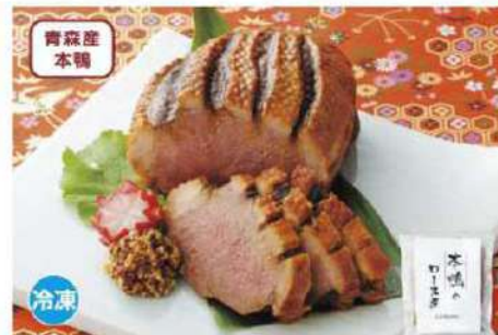
088 青森産本鴨ロース煮 240g

アレルギー 卵・乳 賞味期限 30日間 税込価格 2,700円 (本体価格 2,500円)