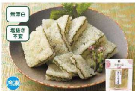
046 味付け子持ち昆布 90g

アラスカの寒流で育った昆布に、にしが産みつけた数の子の食感が絶妙の無漂白の子持ち昆布です。