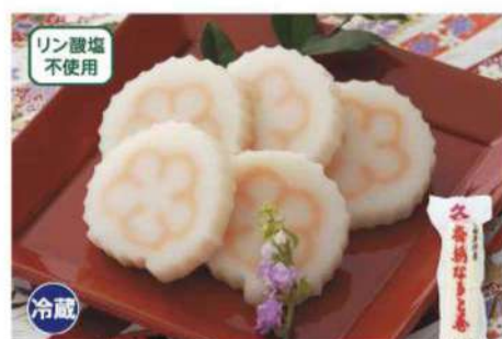
034 梅柄なると巻 150g 新鮮なグチをたっぷり使用し、紅で小田原市の花「梅」の柄を咲かせました。 賞味期限 2025年1月5日 税込価格 702円 (本体価格 650円)