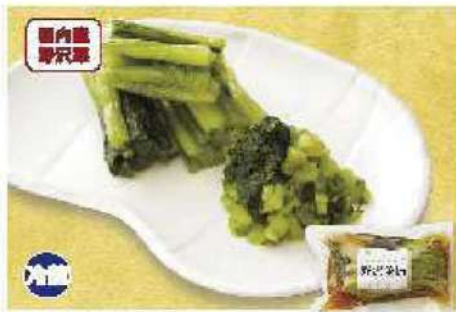
068 野沢菜漬 300g