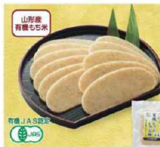
098 有機しゃぶしゃぶ餅・玄米 120g