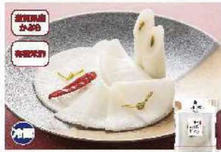
065 聖護院かぶらの千枚漬 150g

冬にとれた旬のかぶらを使った千枚漬は、冬の味わいのひとつです。内原で柔らかな聖護院かぶらを使用。