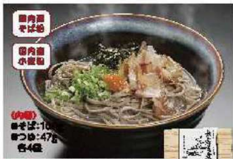
069 出雲年越しそばセット 4人前

アレルギー 小豆・大豆 ¥605円 賞味期限 2025年1月9日 (本体価格 560円)