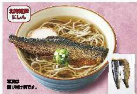
070 北海道産にしんの甘燻煮 2枚

アレルギー 小豆・そば・大豆 ¥2,052円 賞味期限 90日間 (本体価格 1,900円)