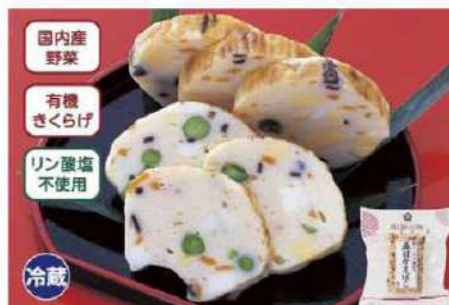
038 五目かまぼこ 120g

国内産の有機きくらげ・にんじん・えだまめ・有精卵を入れた、華やかな扇形のかまぼこです。