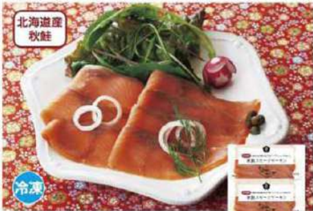
081 秋鮭スモークサーモン 40g×2