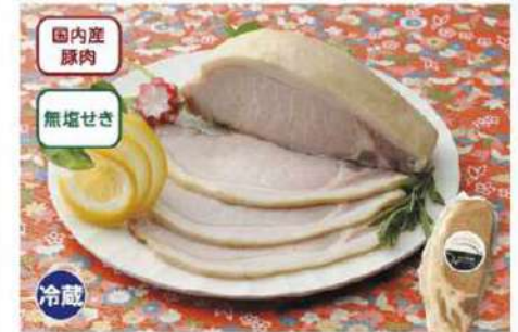
083 アルファー・ロースハム 300g

アレルギー 乳・小麦・大豆 賞味期限 1年間 税込価格 2,052円 (本体価格 1,900円)