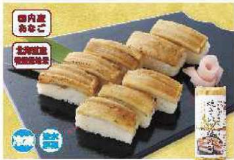
060 焼き穴子押寿司 1本(8切れ)