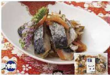
048 にしんの酢漬け 130g

にしんを国内産の人参、北海道産昆布、生姜などとあわせてさっぱりと甘酢漬けにしました。