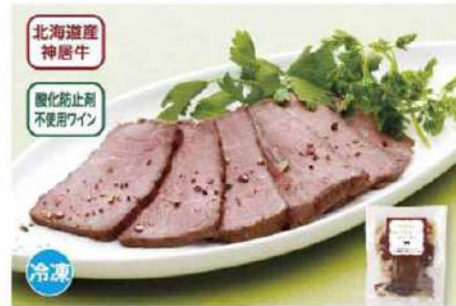
082 神居(かむい)牛のローストビーフ 1個(約130g)