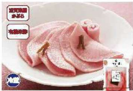
066 紅かぶらの千枚漬 150g

赤く染まった旬の紅かぶらはお正月の食事を華やかにします。内原でやわらかな食感です。