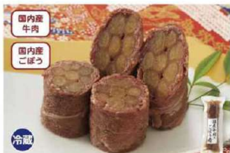
042 国産牛肉のごぼう巻 1本

細く長くつつましく生きることを願った縁起物のごぼうを、国内産牛肉で巻いて煮込みました。