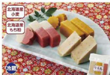
041 なま麩セット(紅白・ごま・かぼちゃ) 120g×3本

希少な国内産小麦グルテンともち粉で作りました。独特のもちもち食感です。おめでたい紅白、香ばしいごま、甘みのあるかぼちゃを3種セット。