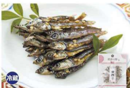
033 田作り(サクサク仕立て) 50g 国内産のかたくちいわしを圧搾一番搾りのなたね油で素揚げし、サクサクの食感に仕上げました。 アレルギー 小麦・大豆 賞味期限 2025年1月15日 税込価格 994円 (本体価格 920円)