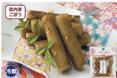
043 たたきごぼう 100g