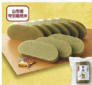
097 特別栽培米使用・杵つき草餅 500g

アレルギー 大豆 賞味期限 60日間 税込価格 1,188円 (本体価格 1,100円)