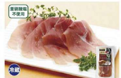
089 フランス産生ハム(ジャンボンド・バイオンヌ) 40g

アレルギー 小麦・大豆 賞味期限 180日間 税込価格 3,240円 (本体価格 3,000円)