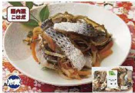
049 こはだの酢漬け 130g

国内産のこのしろを国内産人参、北海道産昆布、生姜などとあわせてさっぱりとした甘酢漬けにしました。