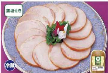
087 信州・ロースハム 400g

発色剤・着色料・保存料・リン酸塩を一切使用しないで作られた信州ハムグリーンマークシリーズのロースハムです。