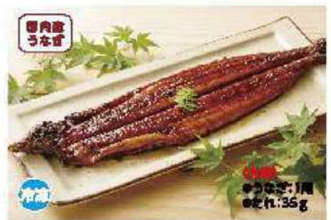
059 紀州備長炭で焼いた炭火焼うなぎ 1冊(約200g)