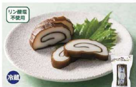
036 昆布巻かまぼこ 1本

富山名産「昆布巻かまぼこ」。魚のもつ旨みと昆布のもつ旨みは相性抜群。添加物にたよらないシンプルな味わいです。