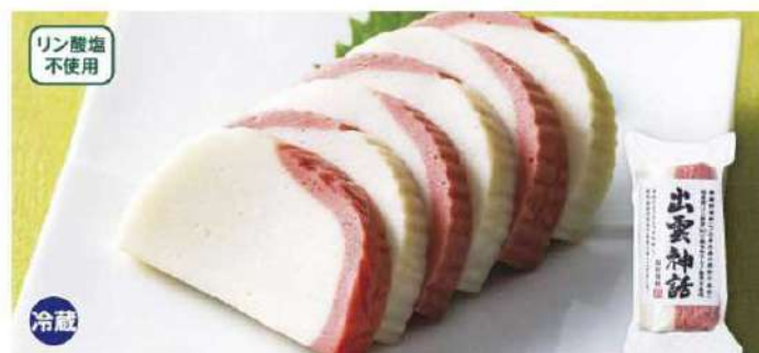
013 かまぼこ出雲神話(紅白) 1本(180g)

賞味期限 2025年1月10日 税込価格 2,052円 (本体価格 1,900円)