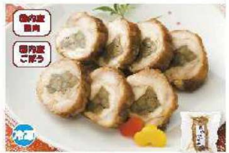
053 鶏もも肉の八重巻 1本(180g)