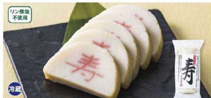
009 お正月用かまぼこ(寿)白 1本(180g)

賞味期限 2025年1月10日 税込価格 1,566円 (本体価格 1,450円)