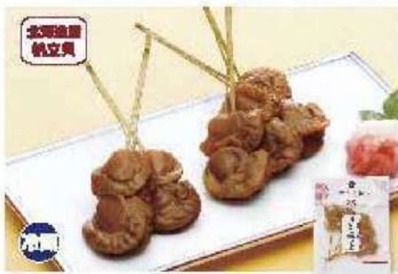
051 はたて松葉串 5本