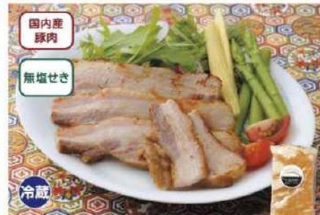
085 アルファー・ペーコン 180g

賞味期限 2025年1月3日 税込価格 2,268円 (本体価格 2,100円)