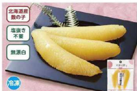
045 味付け数の子(国内産数の子) 3本

北海道産のニシンの魚卵を使用。塩抜きの手間がかからず、解凍してすぐに食べられます。