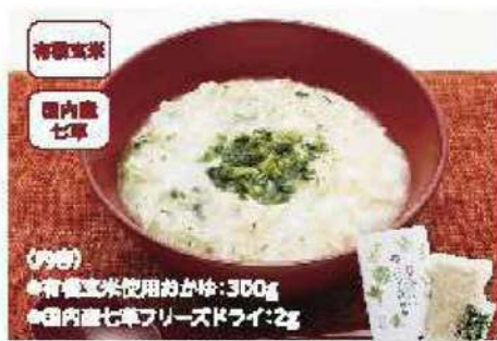
071 有機玄米使用七草がゆ 2人前

アレルギー 小豆・大豆 ¥1,016円 賞味期限 90日間 (本体価格 940円)