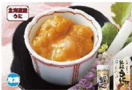
054 北海道産うどん 60g

キタムラサキウニと少量の醤油のみで作りました。ウニ本来の柔らかい甘味と旨味を堪能いただけます。